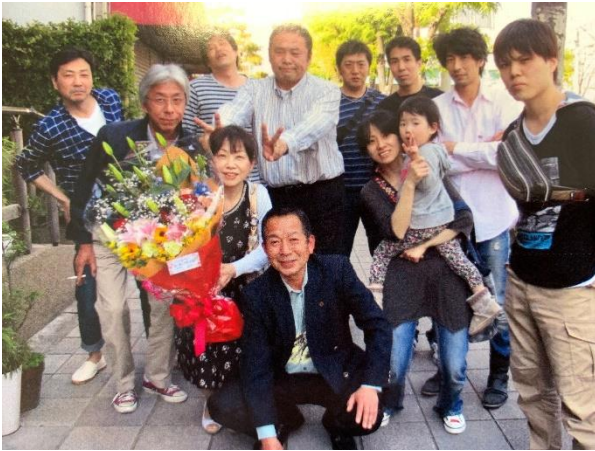
～集合写真～ 前左門殿分団長と一緒に撮影