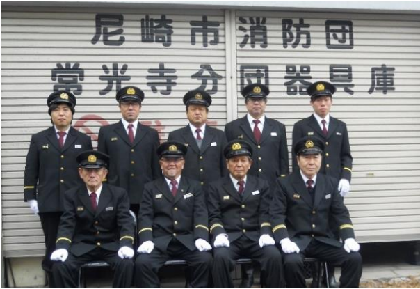
～2018年～ カッコいい制服姿で集合写真