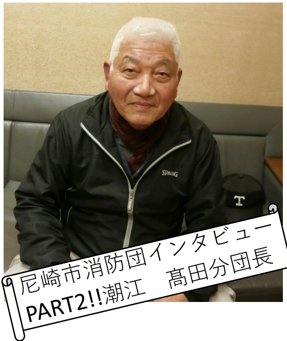
尼崎市消防団インタビュー PART2!! 潮江 高田分団長