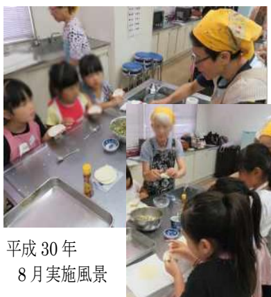
平成30年 8月実施風景