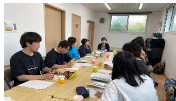
手をつなぐ育成会