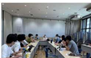
身体障害者連盟福祉協会

(協力団体) 身体障害者連盟福祉協会、手をつなぐ育成会、就労支援作業所「ゆるる/がんじゅ」